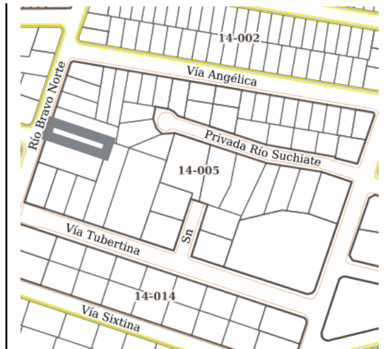
Croquis de Manzana